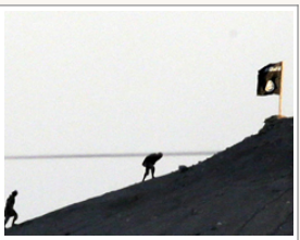
(تصاویر) نبرد با داعش بر سر کوبانی