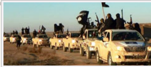
فروش دختران و زنان تا فعالیت در بازار نفت