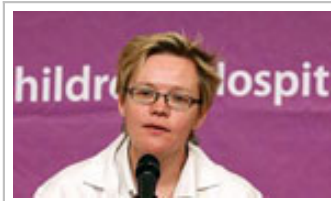
ابتلای کودکان در آمریکا به یک بیماری جدید