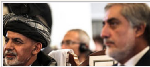
نگرانی‌ها منطقه‌ای مانع نشد