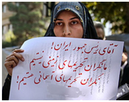
(تصاویر) حواشی حضور روحانی در دانشگاه