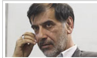
باهنر: خاتمی باید جبران کند/ اجماع نهاد دینگ نام جناب